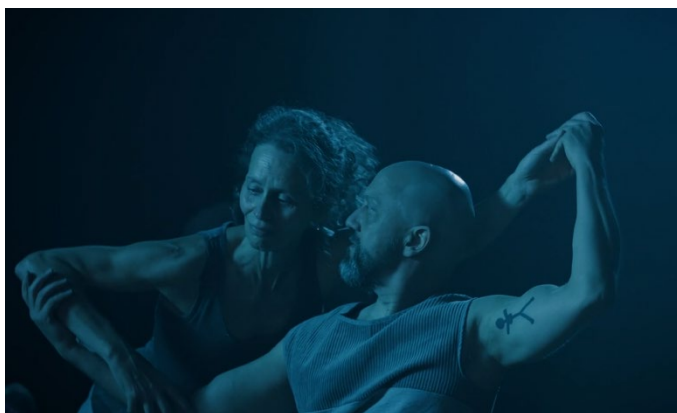
Screenshots aus dem Film, Fotos: Steven Vit

Der Kurzfilm, Tanz ist eine Sprache, oder? , der 2024 im Rahmen der Ausstellung DANCE! entstanden ist, war bis Ende August im Museum für Kommunikation Bern zu sehen. Zudem wurde der Film für Dance on Screen ausgewählt und im Mai im Rahmen des Tanzfests in Winterthur, St. Gallen und Chiasso im Kino gezeigt. International wurde der Film im InShadow Festival in Lissabon, Rahmen des Festivals PreOKRET Festival in Rijeka (wo auch FOREST aufgeführt wurde) und auch am Artability Hub in Kairo präsentiert.