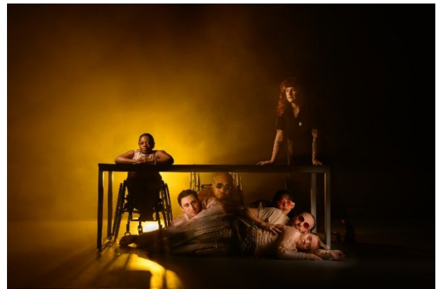
NoAnger, & Stopgap Dance Company