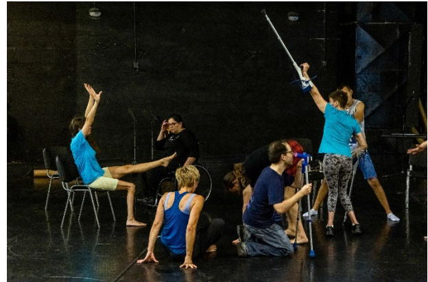
Workshop in Rijeka, begleitend zum Auftritt von FOREST , Foto: Erik Kučić

Auch im Jahr 2025 fanden zahlreiche Workshops, Trainings und Kursangebote statt: