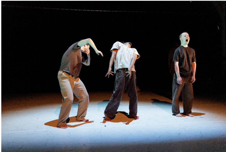
Mir wäre so wohl wenn wir zusammenkommen könnten, Foto: Silvia Rohrbach

2025 war für BewegGrund erneut geprägt von intensiver künstlerischer Arbeit, vielfältigen Projekten und einer wachsenden öffentlichen Präsenz. Neben zahlreichen Gastspielen im In- und Ausland realisierte der Verein ein breites Angebot an Workshops, Trainings und Kursen für unterschiedliche Zielgruppen. Mit der 14. Ausgabe von BewegGrund.Das Festival , die ganz im Zeichen der Zugänglichkeit stand, setzte der Verein zudem einen inhaltlichen Schwerpunkt, der die kontinuierliche Auseinandersetzung mit inklusiver künstlerischer Praxis sichtbar machte.