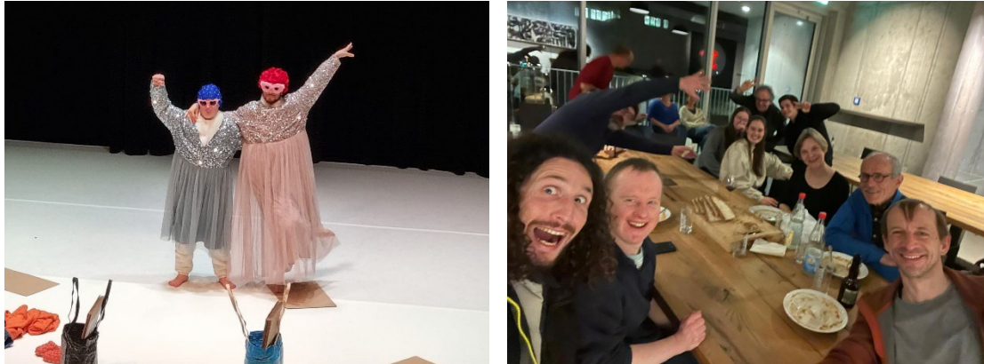
Während und nach der Aufführung in Reutlingen

Das Kinderstück Goodbye Stracciatella setzte seine erfolgreiche Reise auch im Jahr 2025 fort. Das Stück war in Le Locle, Reutlingen, Winterthur, Lugano, Delémont sowie in Esch-sur-Alzette (Luxemburg) zu sehen.